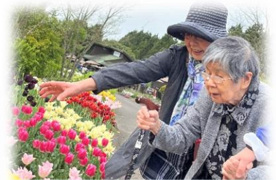
色々な種類のチューリップ。