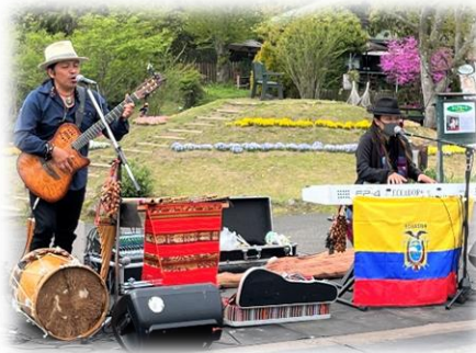
生演奏も聞けました。