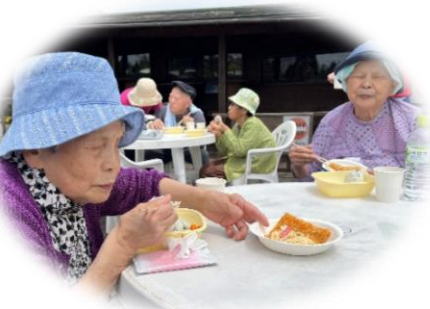
昼食はおにぎり弁当。