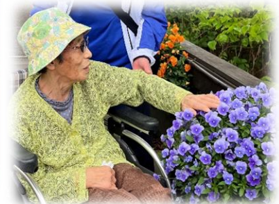
ビオラもきれいでした。