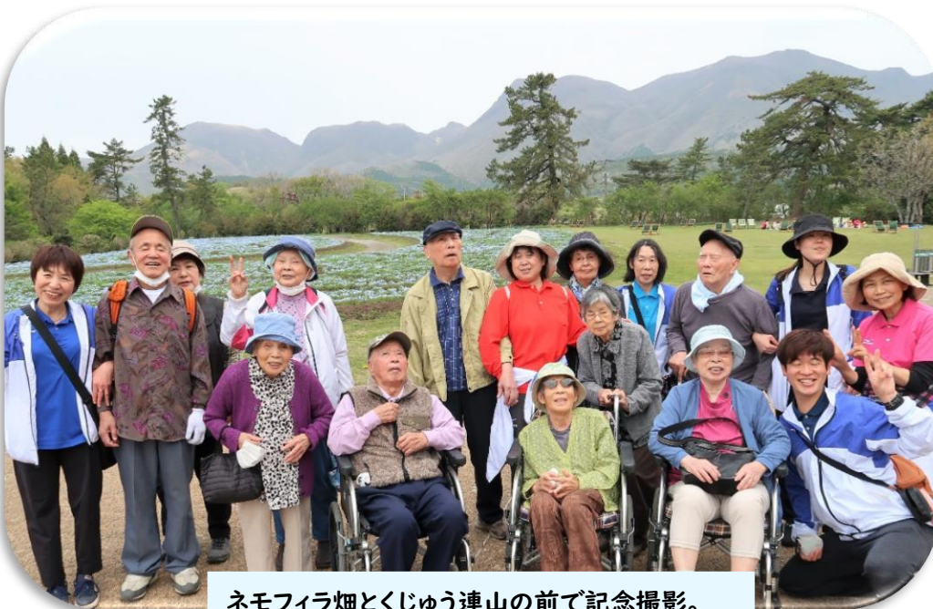
ネモフィラ畑とくじゅう連山の前で記念撮影。